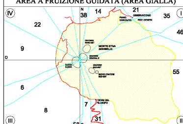
SETTORI ZONA SOMMITALE CON INDICAZIONE AREA A FRUIZIONE GUIDATA (AREA GIALLA)